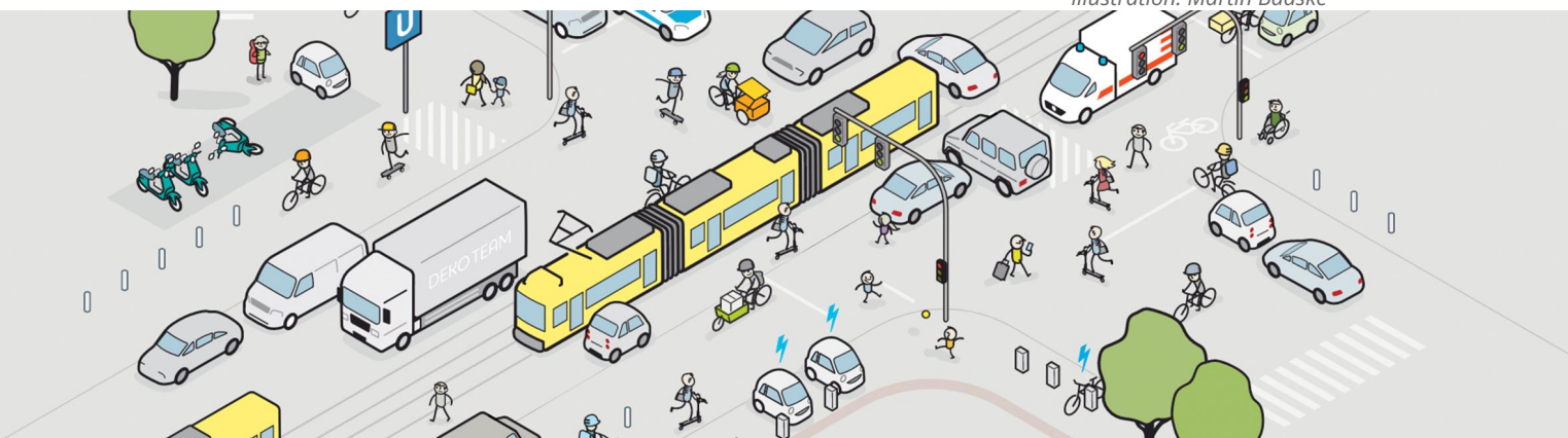
Illustration: Martin Baaske

FixMyCity unterstützt Verwaltungen bei der Umsetzung der Verkehrswende. Das Team setzt sich aus Entwickler:innen, Designer:innen, Verkehrsplaner:innen sowie Datenspezialist:innen zusammen und entwickelt digitale Tools die eine offene und agile Verwaltungsarbeit ermöglichen.